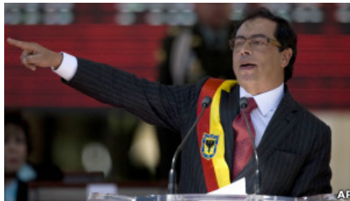
La iniciativa está a cargo del ex guerrillero y ahora alcalde de la capital colombiana, Gustavo Petro.

Y los críticos de la medida impulsada por el