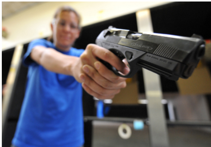
Las restricciones de armas han mostrado ser muy eficientes para bajar los homicidios

CRIMINALIDAD El viejo debate sobre la restricción al porte de armas está de regreso por cuenta del alcalde de Bogotá. Todos los vientos soplan a favor de mayores controles. Sábado 7 Enero 2012