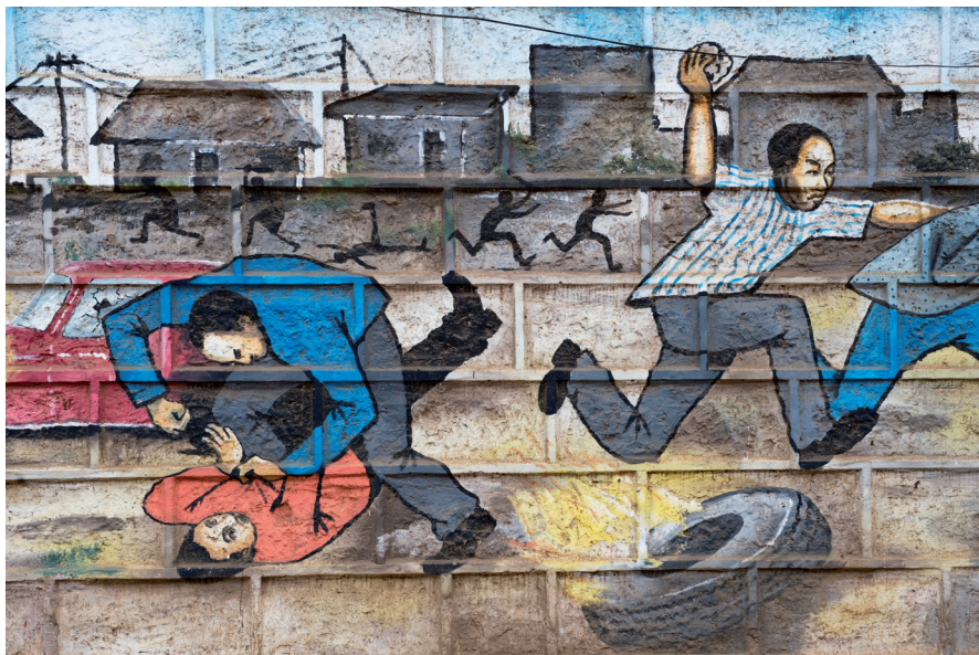
Kenya, Nairobi: Un mural en el tugurio Kibera representando la violencia urbana.

Las pandillas están presentes en las ciudades del mundo y pueden definirse como grupos de jóvenes que se mantienen en el tiempo, cuyos miembros muestran unos hábitos y prácticas ligados al estilo de vida de la calle, y tienen una identidad específica (Klein y Maxson, 2006). Las pandillas pueden recurrir a actividades criminales y en su mayoría están conformadas por jóvenes adolescentes. Como se señaló anteriormente, algunas de las políticas dirigidas a estos grupos pueden criminalizar comportamientos cotidianos (como pasar el tiempo libre en las calles), estigmatizando las identidades colectivas (Young, 1999; Brotherton, 2007). En efecto, estas políticas pueden fortalecer sentidos de resistencia colectiva, los cuales funcionan como el “pegamento social” de agrupaciones como las pandillas (Castells, 1999,