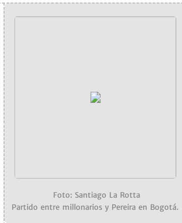
Partido entre millonarios y Pereira en Bogotá.